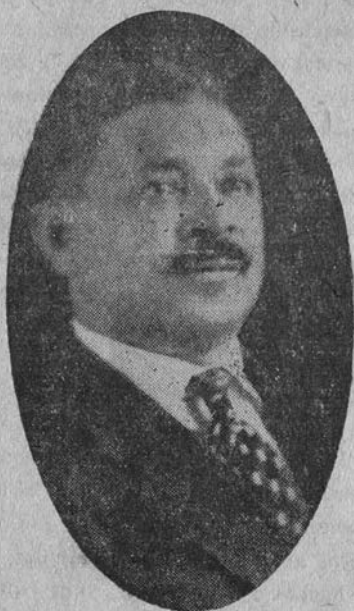
DR. EFRAIN TEJADA U., Gobernador de Colón y liberal a toda prueba.

Reúne este dirigente prestigioso y de valía dentro del Partido Liberal, características dignas de estudio, las mismas que han sido apreciadas por sus conciudadanos de uno y otro bando político.